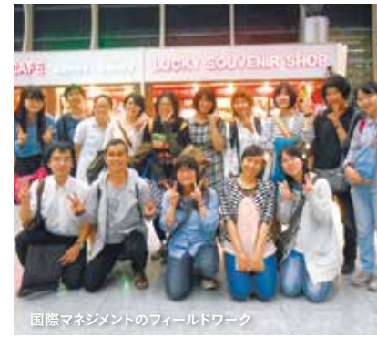
国際マネジメントのフィールドワーク

大学の食堂も大好きですが、たまに贅沢して環境科学部棟近くのカフェClap diningに行きました。在学中に今の場所に移転され、近くなって嬉しかったのを覚えています。オムライスが絶品です。