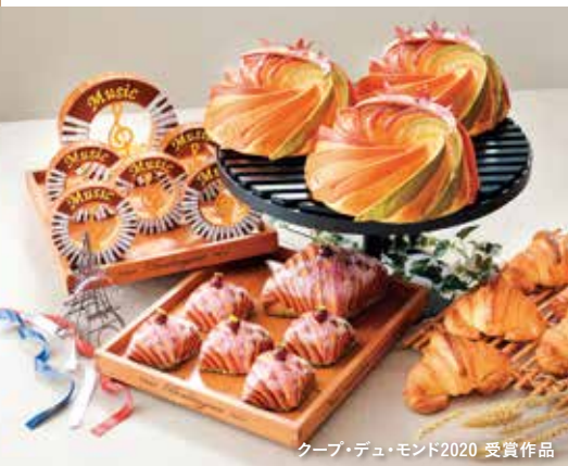
クープ・デュ・モンド2020 受賞作品

勉強はもちろん、部活やサークル、アルバイトなどさまざまなことにチャレンジできるのが大学時代の魅力。そこで得た経験や出会った人たちの関係は、社会人になってからの財産になります。学生のみならず、滋賀県立大学ならではの素晴らしい環境を活かして多くのことを経験し、仲間たちと楽しく有意義な4年間を過ごしてほしいです。