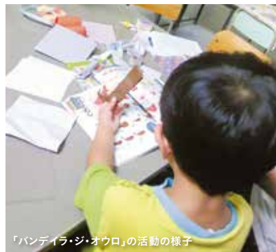
「バンディラ・ジ・オウロ」の活動の様子

「近江楽座」の活動を通じて、多文化共生の問題について学べたことも、私にとって大きな経験となりました。滋賀県は外国人労働者が多い地域で、ほとんとは非正規雇用で工場などで働く