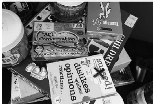
子どもたちのサポートグッズ (感情表出のトレーニング用)