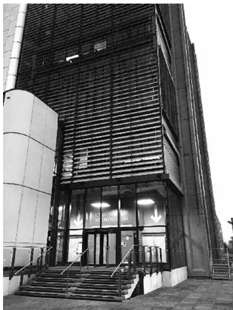
University of Birmingham