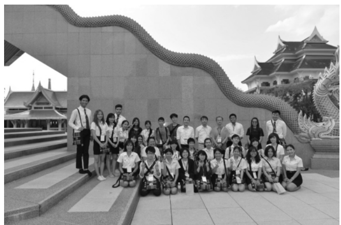
図2 ワット・ポーティソムポーンで記念撮影(シティツアーにて)

最後に、この講義には大学院生の参加も見込み、国際環境マネジメント特論として環境動態学の大学院講義の単位が認定できるようにしている。大学院生として参加する場合、交通機関や見学先の選定、英文でのメー