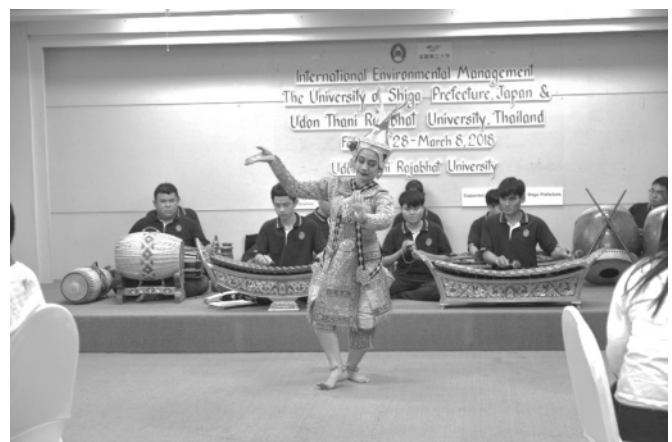
図1 芸術を学ぶ学生による民族楽器の演奏およびタイ舞踊の披露