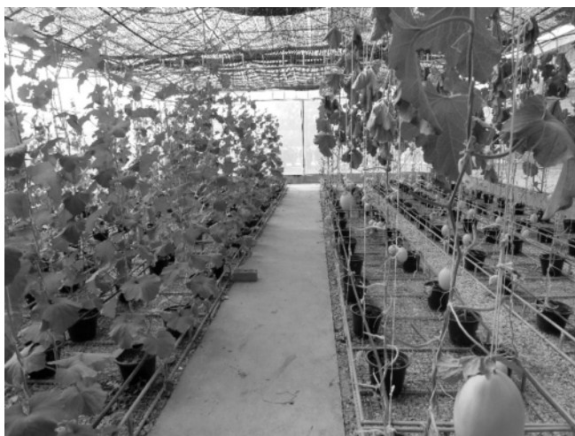
図2 メロンのハウス

これらのことより私が考えたことは、タイは熱帯性気候のため、多湿や害虫の被害も多いと考えられるが、ビニールハウスによる栽培ならそれらの悪条件をある程度コントロールでき、逆に熱帯性気候を生かした栽培を行えると考えられるため、野菜などの栽培において省力化と栽培作物の高品質化をもたらし、農家の収入を向上させる大きな一手となるはずだ。また、高品質の作物は国内消