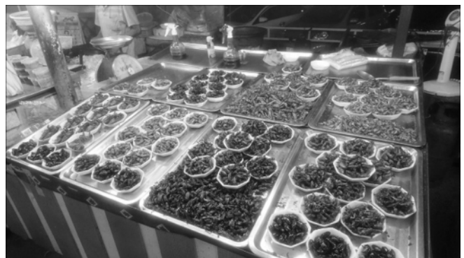
図3 昆虫料理を販売する露店

今回の研修では、タイで起こっている環境問題の具体的な例や自然、文化について、タイの学生さんから教わりながら、より理解を深めることができた。このプログラムを通して、多くのタイの学生さんと仲良くなり、今でも連絡を取り合っている。海外の学生さん達とのつながりができることも、このプログラムの大きな魅力である。